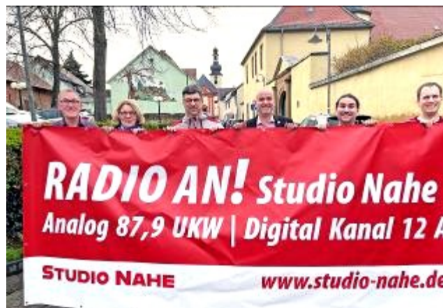
Aktive aus dem „Studio Nahe“.

Gestemmt wird das Programm von 13 Ehrenamtlichen. Sie werden mit Material des Bistums Trier, von domradio.de, Vatican News, Radio NRW und