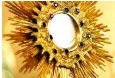
Zeit der eucharistischen Anbetung im

Frau Weiler-Beck macht es möglich. Montagabends nach der Hl. Messe wird es am 2. und 4. Montag im Monat eine