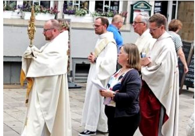
Ein Blumentepich wies den Weg zum Altar, und in einer Prozession wurde das Allerheiligste durch die Stadt getragen.