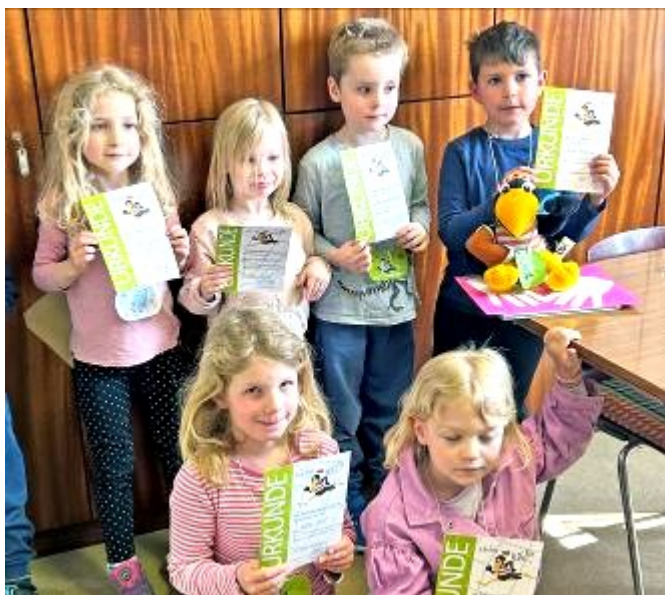
Die Kinder freuten sich über den Büchereiführerschein.