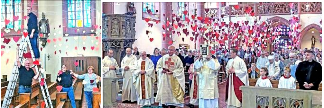
Großeinsatz des Vorbereitungsteams: Es bastelte 1300 Herzen und schuf damit am Muttertag eine liebevolle Atmosphäre beim Gottesdienst in Heilig Kreuz. Noch mehr Herzen wurden an die Besucher verteilt.