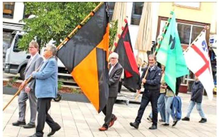
Ministranten und Fahnenräger der katholischen Verbände waren bei der Prozession mit unterwegs.