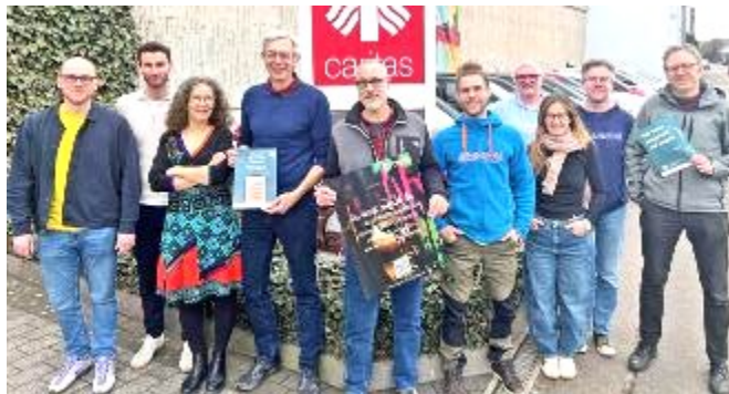
Suchtberatende der Caritas aus den Standorten Bad Kreuznach, Boppard, Idar-Oberstein und Simmern.